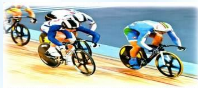
ВЕЛОСИПЕДНЫЙ СПОРТ (велосипедист)